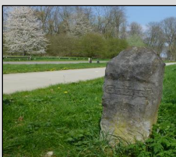
Grenssteen Gelre Gulick

Voor leden van de Heemkundekring “Echter Landj” en van de “Natuurhistorische Vereniging Pepijnsland” bedraagt de voorintekeningprijs € 20. Alle andere belangstellenden betalen € 24.