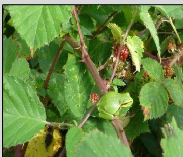
Icoon van de Doort: de Boomkikker